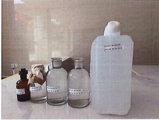
鹤山北控水务第三水厂出厂水样品