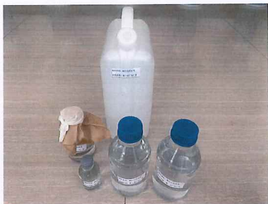
鹤山北控水务第二水厂出厂水样品