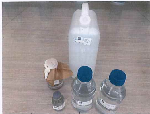
鹤山北控水务第二水厂出厂水样品