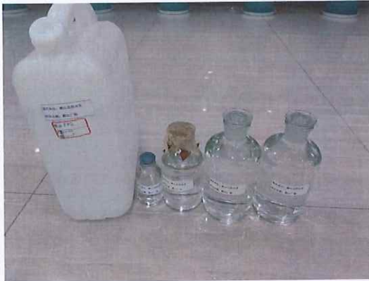
鹤山北控水务鹤山广场样品