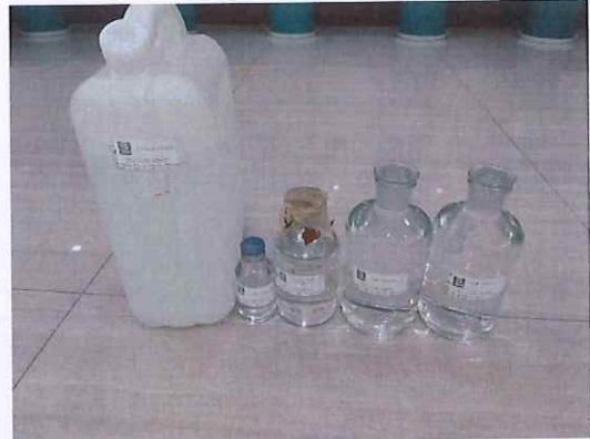
鹤山北控水务鹤山广场样品