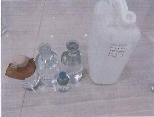
鹤山北控水务第二水厂出厂水样品