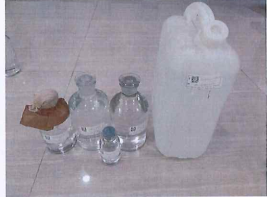
鹤山北控水务第二水厂出厂水样品