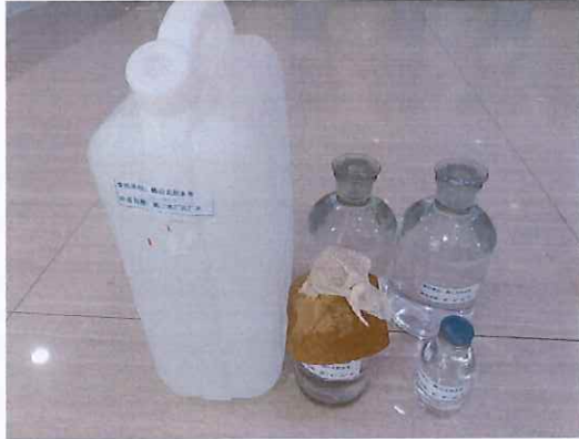
鹤山北控水务第二水厂出厂水样品