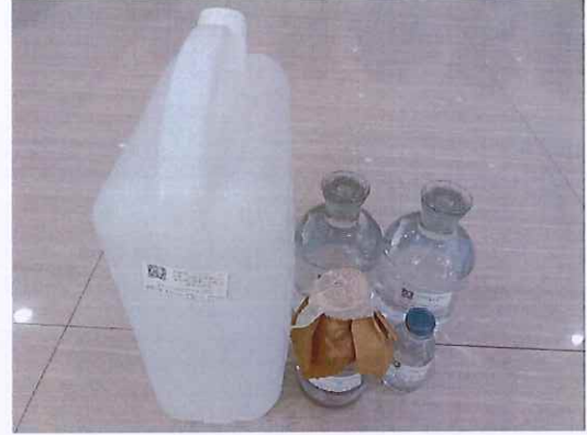
鹤山北控水务第二水厂出厂水样品